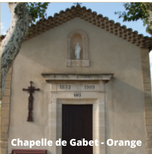
Chapelle de Gabet - Orange

Transport en car Participation aux frais : 20 euros Inscriptions avant le 21 mai au secrétariat paroissial: Tél: 04 75 96 41 06 paroisse.smct@valence.cef.fr