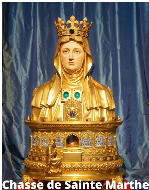
Chasse de Sainte Marthe